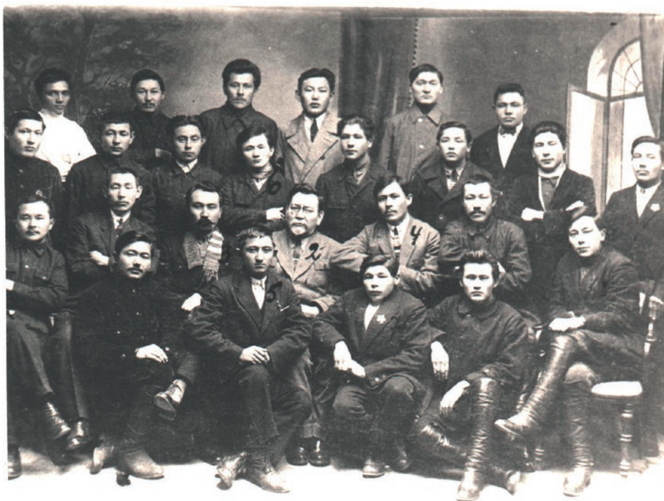
Ректор Казахского института народного просвещения С. Сейфуллин с А. Байтурсиновым среди учителей и студентов. Кызылорда. 1922 год

которую он описал в своём объёмном и увлекательном романе «Тар жол, тайғак кешу» («Тернистый путь»). Год двух революций – 1917-й – сделал 23-летнего молодого человека по-настоящему государственным деятелем. Издатель революционно-демократической газеты, к тому же – руководитель молодёжной организации на съезде совета рабочих и крестьянских депутатов в Акмолинске был избран одним из его руководителей (членом президиума) и комиссаром просвещения.