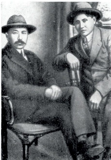
Сакен Сейфуллин и Сабит Муқанов, 1927 год

Сакен Сейфуллин был великим гражданином и поэтом с большой буквы, масштаба и силы Владимира Маяковского, что не раз отмечалось его современниками и потомками. И ещё он был